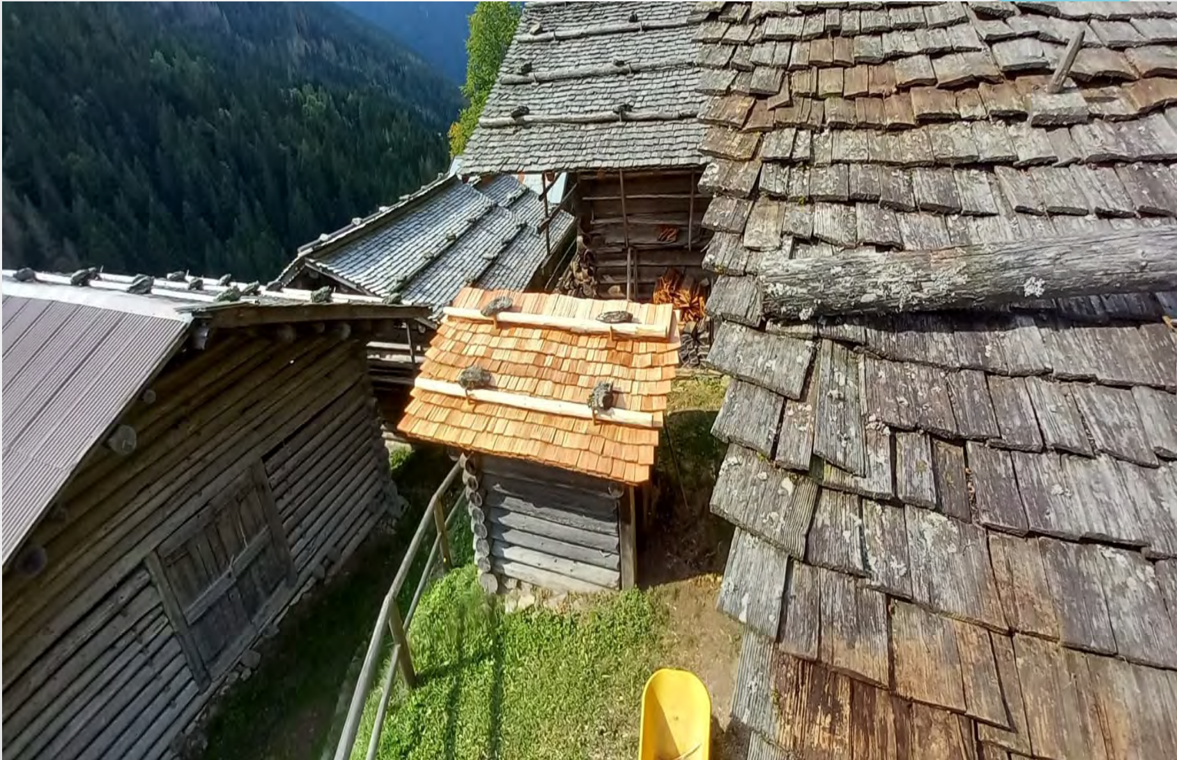
Rifacimento di un manto di copertura in scandole di larice