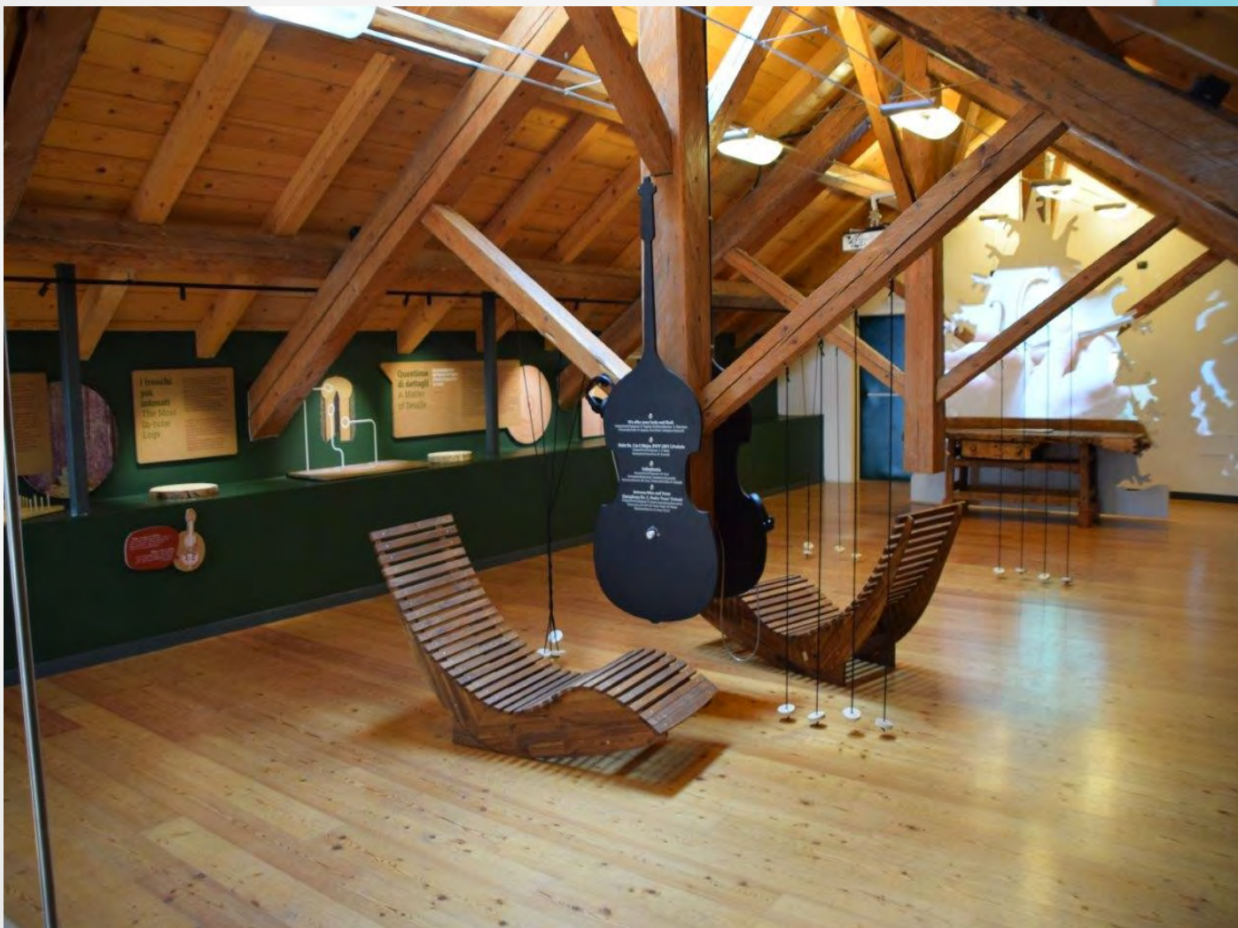
Nuovo allestimento Centro visitatori di Paneveggio