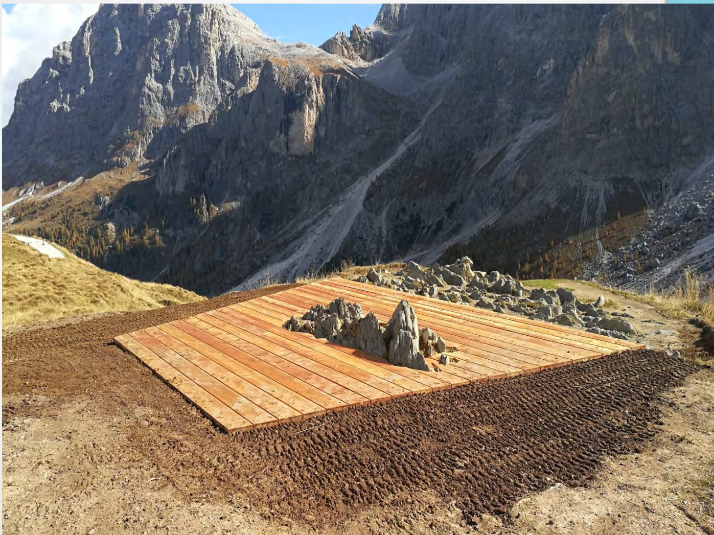
Fase intermedia realizzazione Balcone panoramico Baita Segantini