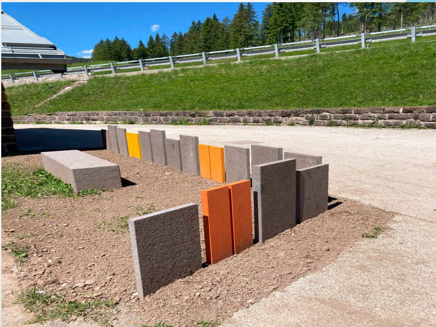
Lavori sistemazione esterni nuovo Centro visitatori di Paneveggio