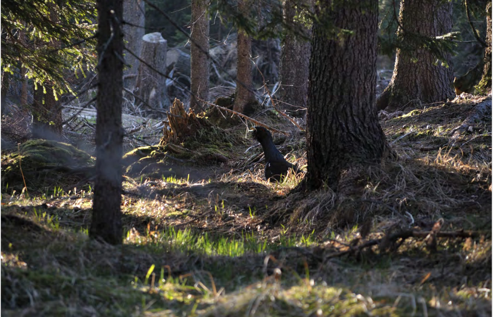
Censimento gallo cedrone