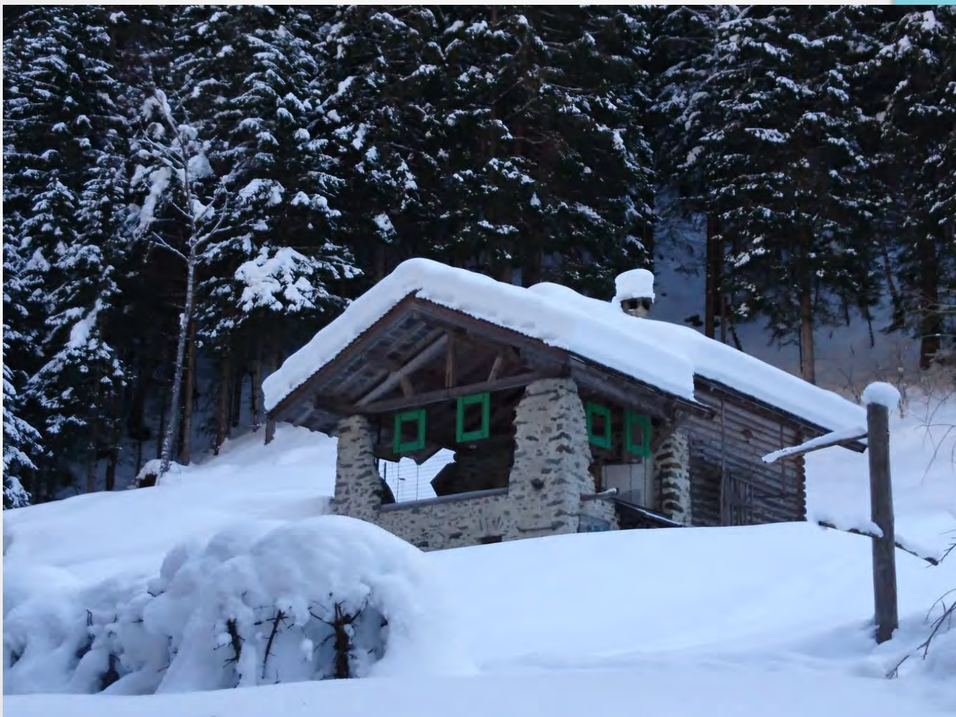
Punto info Prà de Madego - Caoria