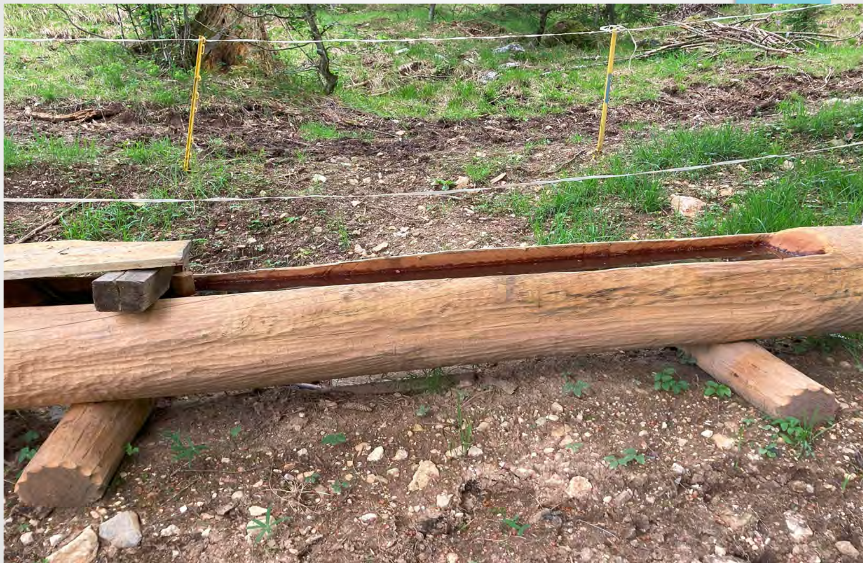
Posa in opera di un nuovo abbeveratoio in larice per il bestiame