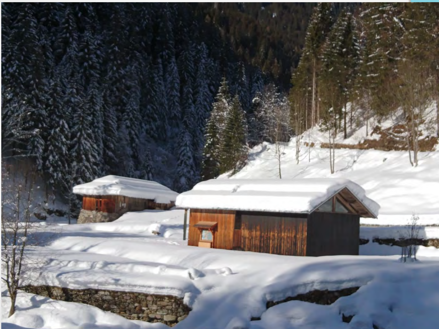
Manutenzione segheria Valzanca - Caoria