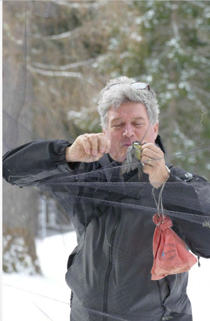
Cattura avifauna Villa Inferiore