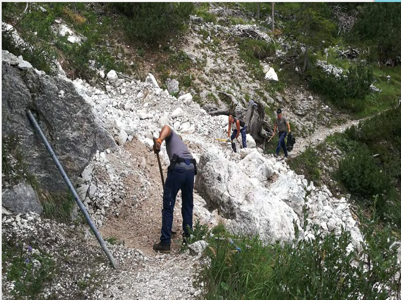
Manutenzione sentieri alpini