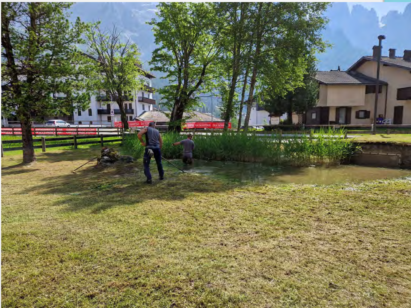
Sistemazione stagno Centro visite San Martino di Castrozza