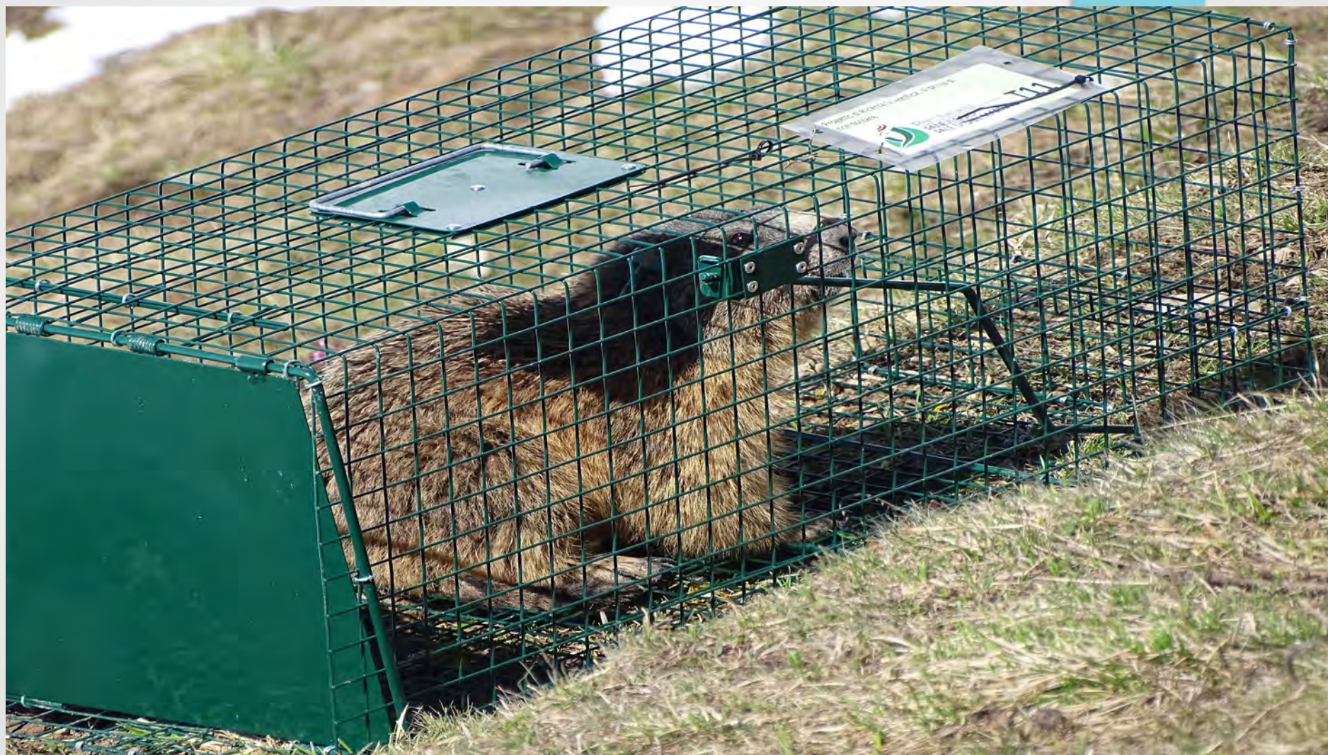
Operazioni cattura marmotte