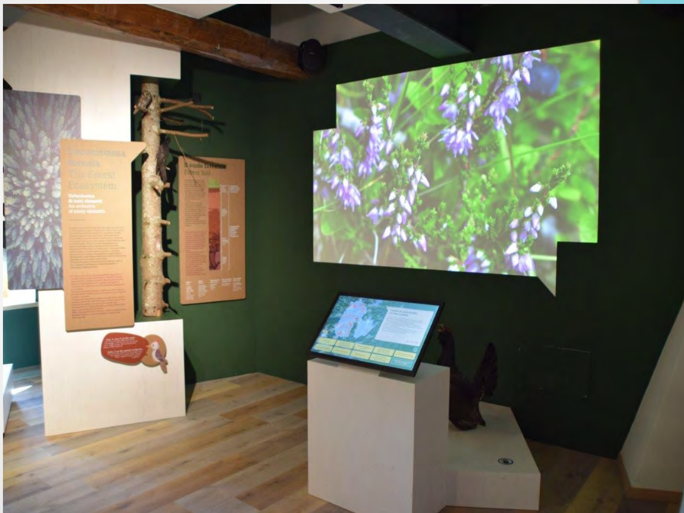
Nuovo allestimento Centro visitatori di Paneveggio