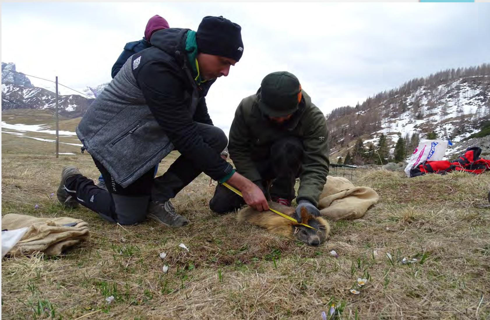
Misurazione e rilievi esemplari catturati