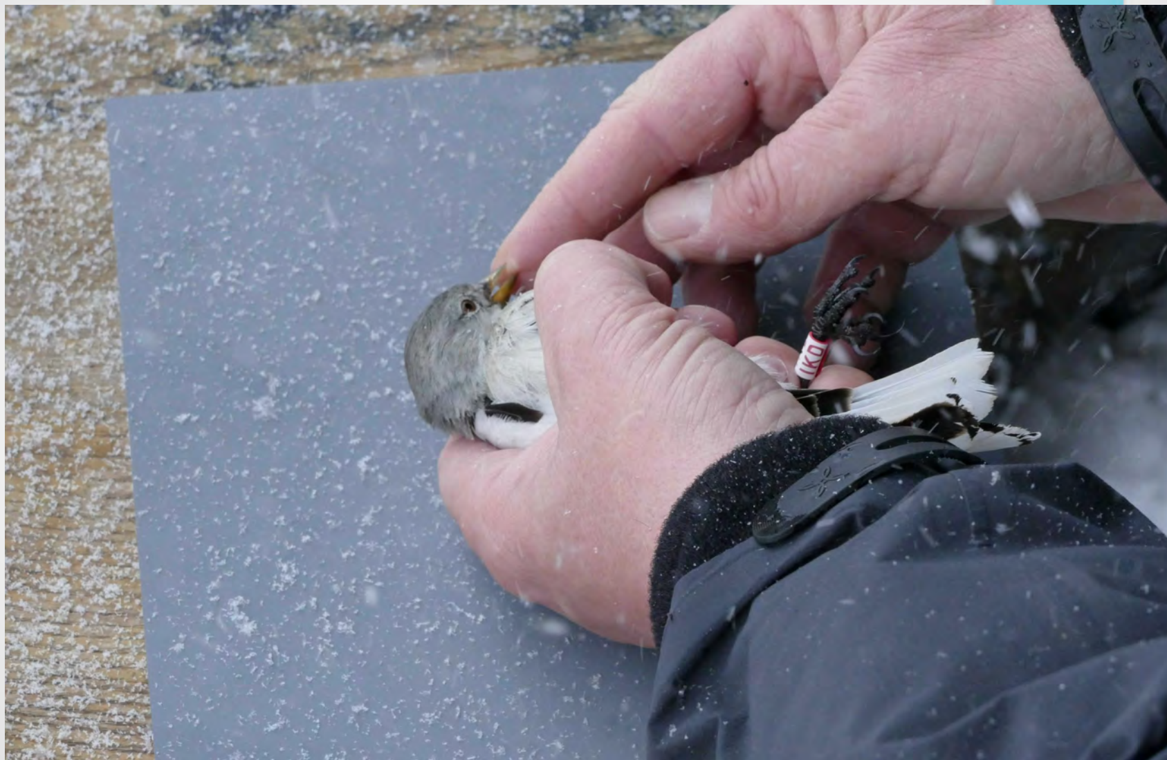
Cattura fringuello alpino