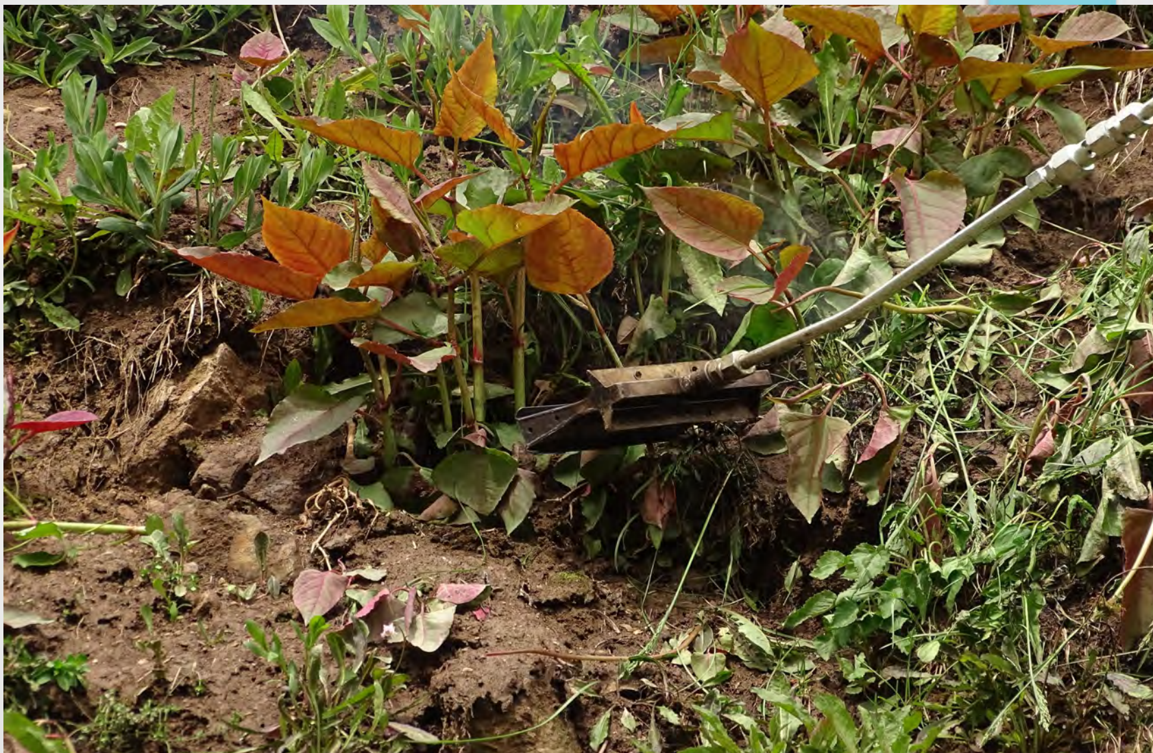
Bruciatura poligono giapponese