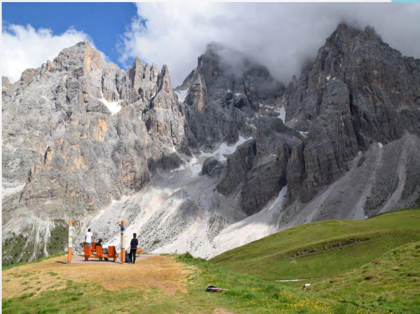
Balcone panoramico Baita Segantini - lavori conclusi