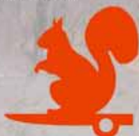
Gruppo Scoiattoli Cortina