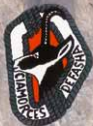
"CIAMORCES" VAL DI FASSA