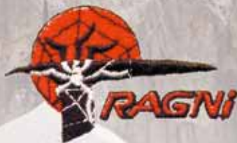
"RAGNI" PIEVE DI CADORE