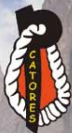
"CATORRES" VAL GARDENA