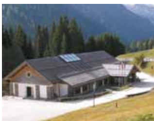
Centro Visitatori di Paneveggio tel. 0462/576283 ogni giorno dal 16 giugno al 9 settembre ed inoltre 15, 16, 22 e 23 settembre (dalle 9 alle 12.30 e dalle 14 alle 17.30)

Situato poco lontano dal Lago di Forte Buso, lungo la statale N.50 che da Predazzo sale al Passo Rolle, il Centro Terra Foresta di Paneveggio racconta della grande foresta omonima di abete rosso, ormai a tutti nota come la Foresta dei Violini per la qualità dei suoi abeti di risonanza usati dai liutai per la costruzione di casse acustiche di strumenti musicali. E racconta degli animali del bosco, i più rappresentativi tra i quali sono senz'altro l'urogallo ed il cervo. Poco lontano, un grande recinto permette di osservare da vicino un gruppo di questi grandi ungulati. Dal Centro Visitatori parte un percorso naturalistico con punti di osservazione guidati e illustrati.